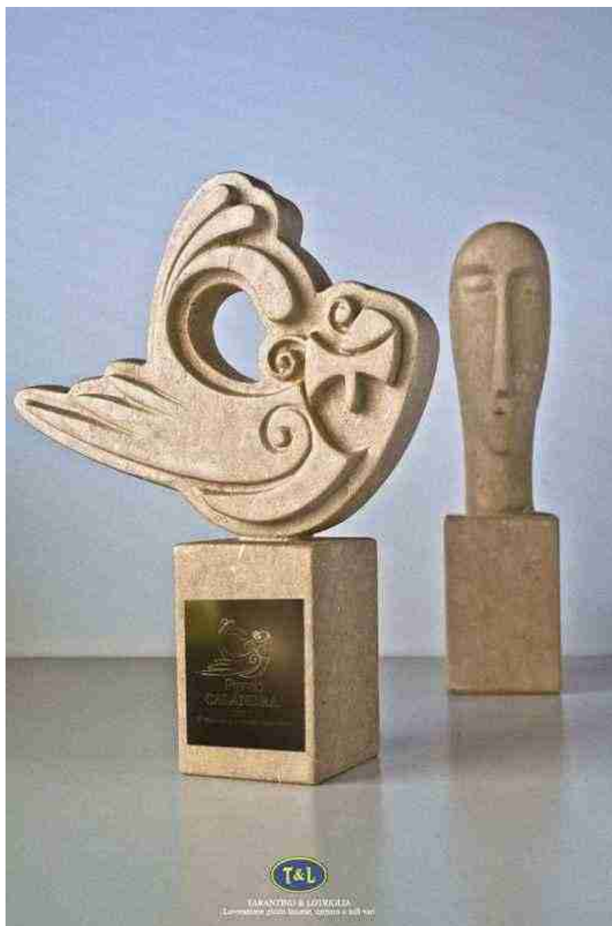
Trofeo Premio Calandra