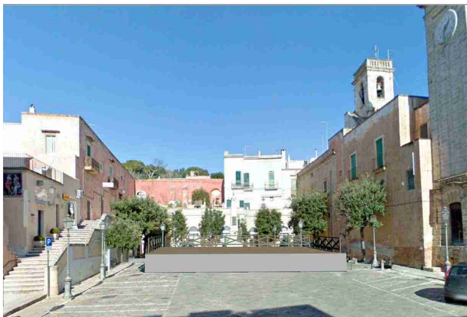
Location: Piazza Garibaldi con vista frontale palcoscenico

Scheda tecnica per dimensioni palco messo a disposizione dall'organizzazione N.B. l'organizzazione non fornisce nessun fondale e quinte per allestire il palco